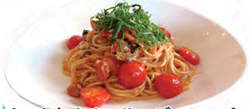
トマトとオイルサーディンのパスタ Tomato & Oil Sardine 1,200円