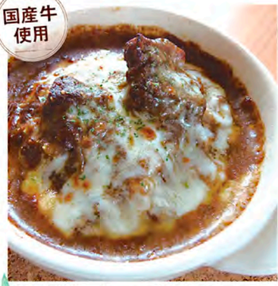
自家製ビーフ焼きカレー Homemade Grilled Beef Curry 1,200円