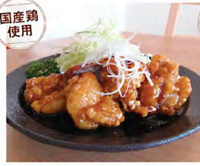
宮地浜チキン南蛮定食 ~めんたいマヨ添え~ Mizaki style Chikin Nanban 1,200円