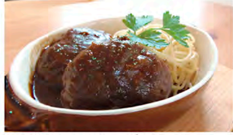
自家製ハンバーグランチ Homemade Hamburger steak 1,400円