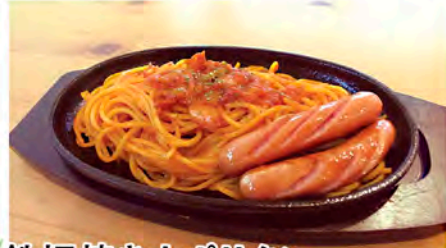
鉄板焼きナポリタン Spaghetti Napolitana 1,200円 ★お子様向けにお皿での提供も可能です