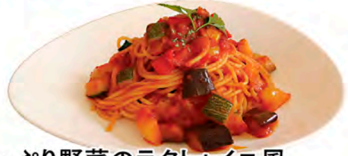
たっぷり野菜のラタトゥイユ風 Ratatouille Style 1,200円