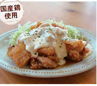
チキン南蛮定食 ~タルタルソース~ Chikin Nanban 1,200円